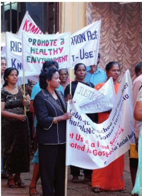
Ville de Goa, Inde – Des femmes préparent une manifestation en faveur de droits civils et d'un environnement sain ; 26 Novembre 2007

L'EAD forme avec succès des personnes qui peuvent transmettre ces valeurs au sein de la société et favoriser un soutien public plus large et plus profond, ce qui s'avère crucial pour le succès de n'importe quel mouvement en faveur de la justice mondiale. Si les ONGs et les institutions publiques souhaitent amener les enjeux du développement et de la justice globale au cœur du débat public et si elles cherchent à y impliquer l'ensemble des citoyens – et ainsi obtenir un réel mandat démocratique pour les changements politiques nécessaires (en particulier sur des thématiques comme le commerce, l'immigration et le changement climatique), elles doivent adopter des politiques beaucoup plus ambitieuses en matière d'EAD.