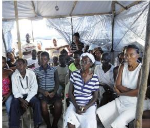
PORT-AU-PRINCE – Rassemblements de résidents en vue de futures actions suite aux atrocités présumées commises par les ONGs à Haïti ; 31 Août 2010

Les principes et approches de ces paradigmes sont à la base de la politique et de la pratique de l'EAD. Dès lors, l'EAD peut être un outil majeur pour les promouvoir et les rendre plus efficaces à l'avenir :