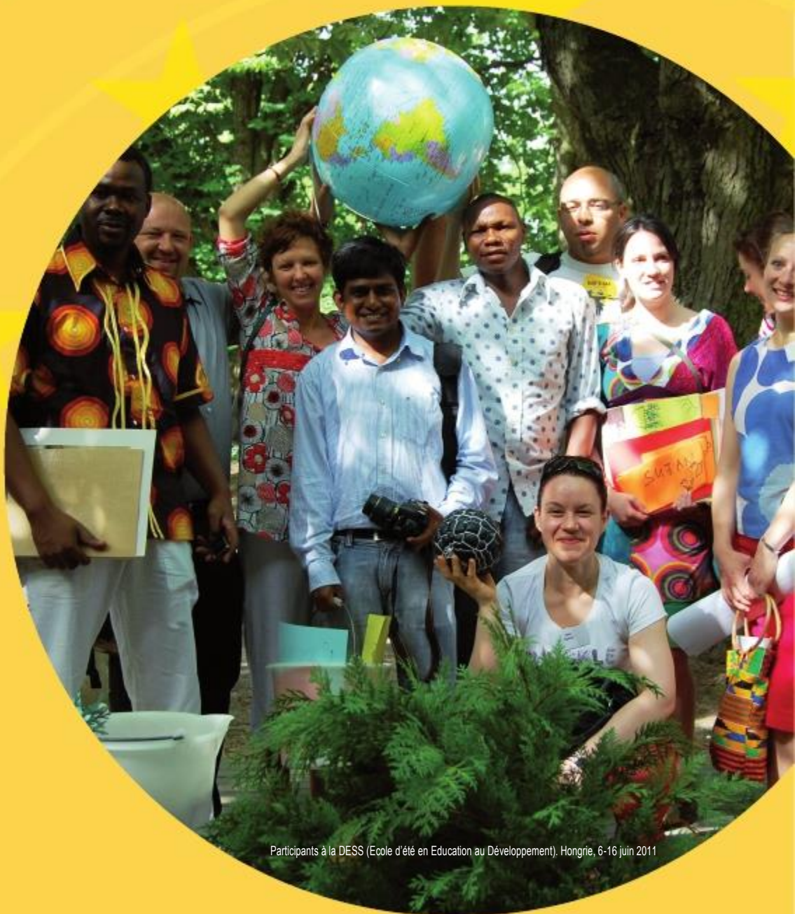
Participants à la DESS (Ecole d'été en Education au Développement). Hongrie, 6-16 juin 2011